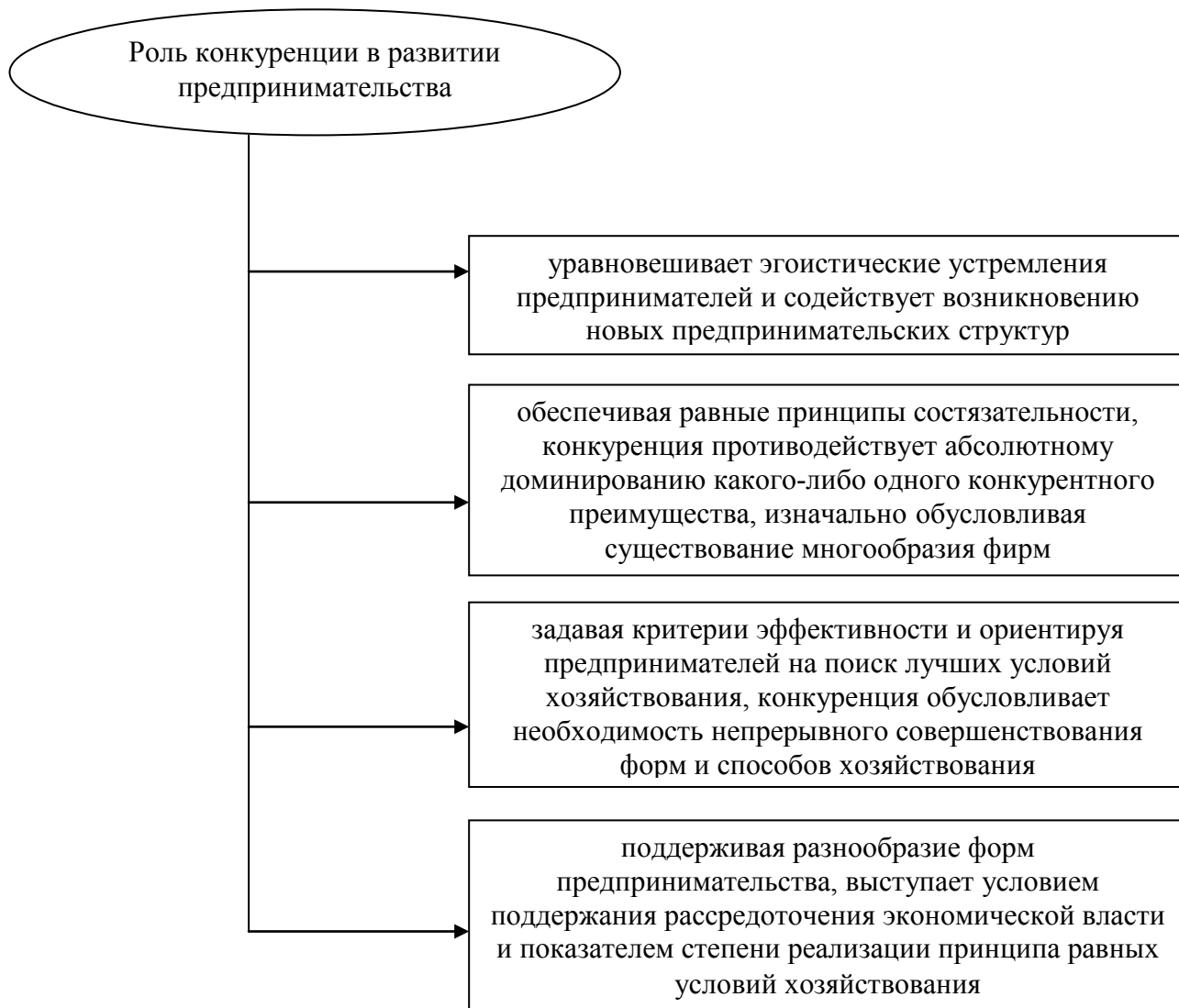
Рисунок 2 – Роль конкуренции в развитии предпринимательства

В то же самое время конкуренция характеризуется тем, что она лишена свойств самоорганизации и неспособна поддерживать условия соперничества. Она не может быть ни результатом согласованных действий, ни следствием поведения хозяйствующих субъектов. Напротив, принуждая к завоеванию преимуществ, конкуренция имеет своим неизбежным следствием рост концентрации рыночной власти у победителей и приводит к возникновению монополии. Это не означает исключения конкуренции, но одновременно указывает на необходимость поддержания воспроизводства конкурентной среды извне как условия ее сохранения. Поэтому конкуренцию следует рассматривать не как способ спонтанной упорядоченности рынка, а как упорядоченную систему, где воспроизводство состязательных условий хозяйствования обеспечивается в том числе и за счет принудительных мер регулирования. Только в этом случае конкуренция сможет играть роль эффективного координатора и фактора развития предпринимательства.